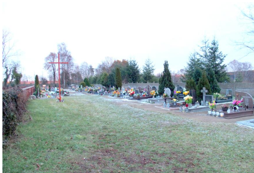
Widok od północnego - zachodu