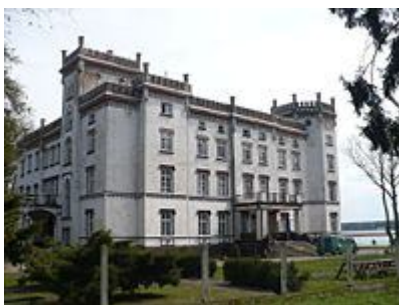
Pałac w Przelazach

I. Charakterystyka miejscowości Przelazy: położona w województwie lubuskim, w powiecie świebodzińskim, południowej części Gminy Lubrza, nad zachodnim brzegiem jeziora Niesłysz., pełniąca w ogromnej mierze funkcje turystyczne.